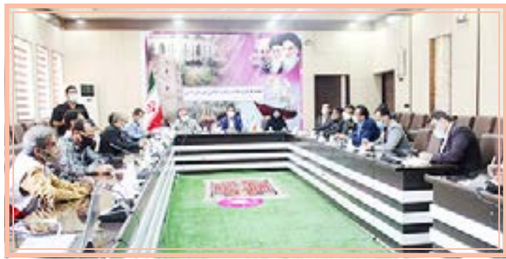
دانشه باشند و اگر مردم نسبت به رعایت مسائل و شیوه‌نامه‌های بهداشتی در مدارس اطمینان حاصل کنند، فرزندان خود را به مدرسه

فرماندار شهرستان دشتی گفت: کلیه دستگاه‌های اجرایی نسبت به اجرا و رعایت دقیق پروتکل‌های بهداشتی اهتمام جدی داشته باشند.